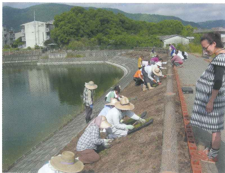
団体名 小山池公園管理委員会

県外客を快く迎えるために地域の環境美化に積極的に取り組み、地域内の小山池の堤防裏法面に「ヨウコソタカマツへ」と霧島ツツジの植栽で文字表現するなど、景観保全に努める活動となっている。