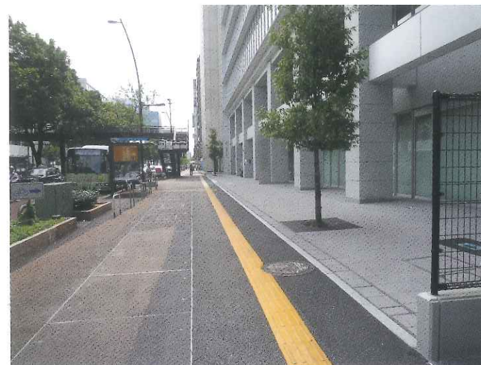
団体名 日本生命保険相互会社

高松一の大通りである中央通りにおいて、歩道に面した総延長が50mを超え、巾3m以上の連続した公共空間を設け、街並みにおける歩行者への利便性向上と、都市景観の向上に寄与する活動となっている。