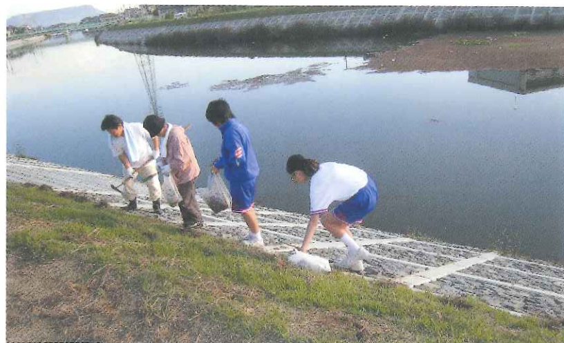
団体名 川島校区コミュニティ協議会

校区住民が美しい花を植え、憩いの空間となるような場所をつくろうと活動が始まり、季節に応じて楽しめるよう草花の種をまき育てるなど、美しい景観づくりを目指す活動となっている。